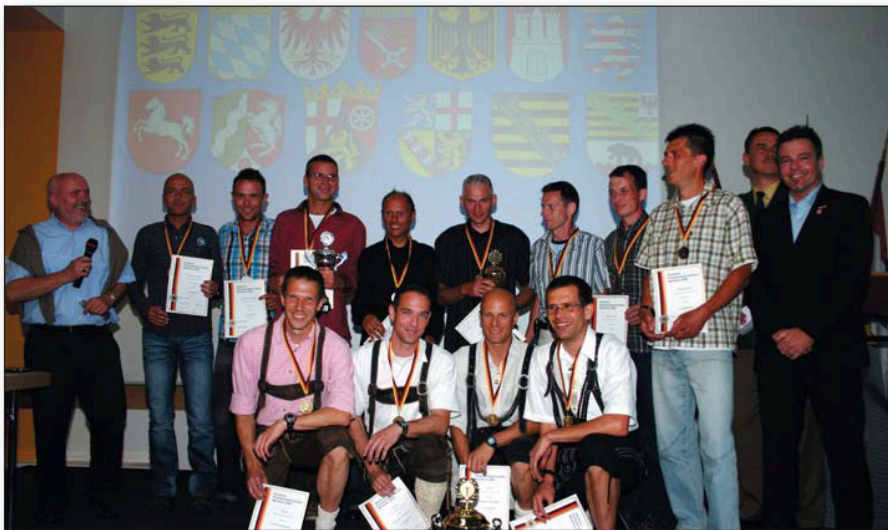
Die Teamwertung gewann bei den Männern Bayern (vorn)...