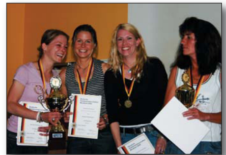
...und Nordrhein-Westfalen bei den Frauen.