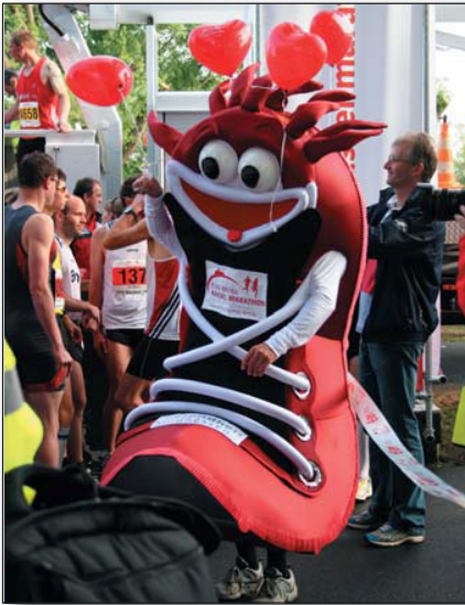
Ein freundliches Maskottchen der Veranstaltung.