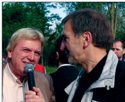
Ein willkommener Interviewpartner, Hessens Innen- und Sportminister Volker Bouffier, der das Feld mit dem Startschuss auf die Strecke geschickt hatte.