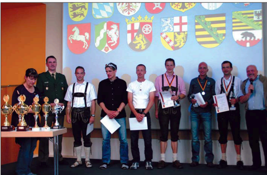
Siegerehrung in der Einzelwertung der Männer...

Unser besonderer Dank gilt daher dem Aus-